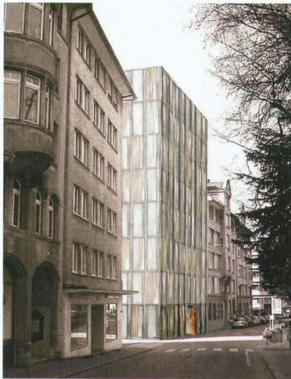
3. Rang / Ankauf: Müller Graf Biscioni Architektur, Winterthur Erdgeschoss und Ansicht von Südwesten