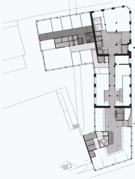
2. Rang / 2. Preis: Keller Schulthess Architekten, Amriswil Erdgeschoss und Ansicht von Norden