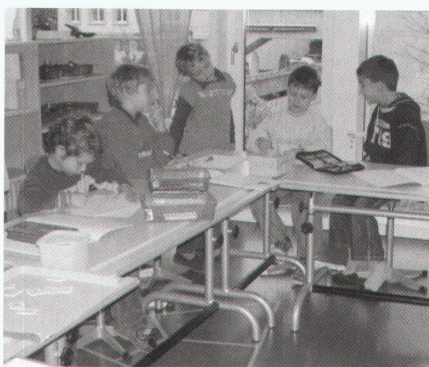
Grundstufe Gesamtschule Unterstrass

Unter der Anleitung einer Lehrperson malen die meisten der anwesenden Kinder konzentriert kleine Kärtchen aus, welche später den Pfeiler der kürzlich eingebauten Galerie schmücken sollen. In unmittelbarer Nähe spielen einige Kinder am Boden mit kleinen Figuren. Es ist nicht klar, welche von ihnen die Kindergärtner und welche die Erst- bzw. Zweitklässler sind. Am Schluss der Stunde bilden alle Kinder mit den niedrigen, im Raum verteilten Stühlen einen Kreis. Was sich wie ein Abschlussritual des Morgenunterrichts