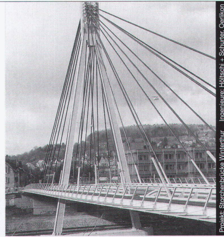
Projekt: Störchenbrücke Winterthur Ingenieure: Höltschi + Schürter, Oerlikon

Nur mit diesem Baustoff sind die grössten Spannweiten möglich, dies mit Berücksichtigung der Wirtschaftlichkeit und des vorteilhaften Leistungsgewichtes. Stahl bietet eine nahezu unerschöpfliche Fülle von Möglichkeiten, Ihre Ideen zu verwirklichen.