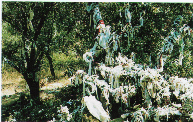
Heiligengräber in Westanatolien

Die Bestattungen und die Gräber in verschiedenen islamischen Gesellschaften unterscheiden sich teilweise erheblich voneinander, da viele Aspekte nicht eindeutig vom religiösen Gesetz geregelt sind. Einige Auf-