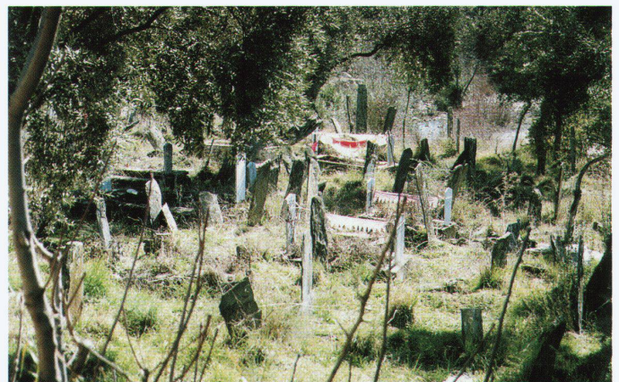
Dorffriedhof in Olivenhain bei Aydin, Westanatolien