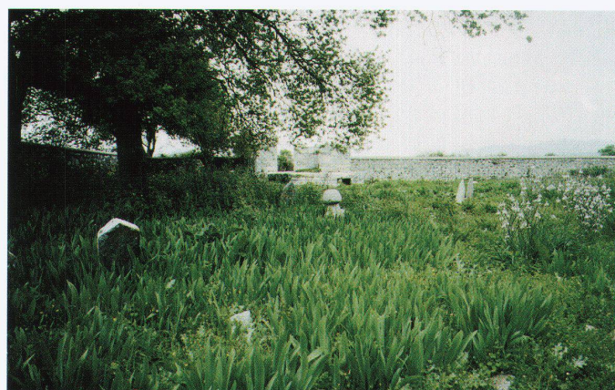
Friedhof Balat bei Milet

S. 33: Friedhof von Ispahan (Iran) (aus: Philippe Ariès, Bilder zur Geschichte des Todes, Hanser 1983)