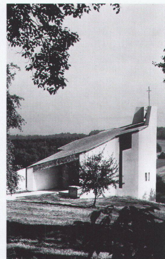
Muttergotteskapelle, Niesenberg/AG, 1961/62