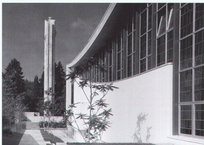
Kirche Heilig Geist, Suhr/AG, 1959/61