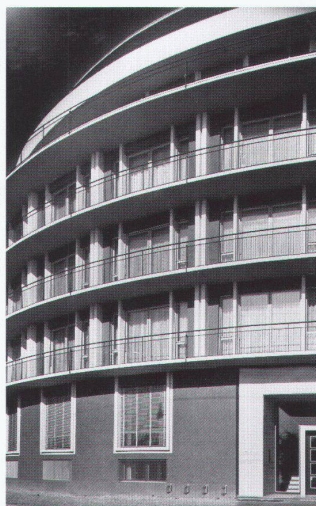
Geschäfts- und Wohnhaus Seepark in Zug, 1953/55