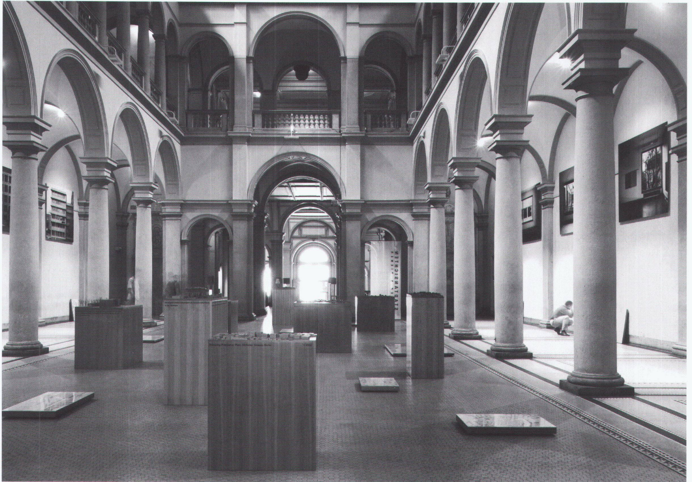
Die Ausstellungssituation als Rauminterpretation an der ETH Zürich

an. «Stadtansichten» sollte methodologisch dem Ausstellungsstandort ETH Rechnung tragen und zugleich eine Diskussion über die Darstellungsformen von Architektur anregen. So legte das Ausstellungskonzept Wert auf eine Kontinuität der Wahrnehmung der sechs Bauten, die in der grossen Bildserie fotogrammetrisch festgehalten sind: Wie ein Moebius-Band sollte das Wechselspiel von innen nach aussen und zurück die übergeordnete Thematik der urbanen Fügungs- und Formprinzipien veranschaulichen. Darin erscheint selbst die Innenaufnahme einer Fenstersituation als lokale Ausprägung in einem Wahrnehmungskontinuum, das die Beziehung von Wand und Öffnung, Form und Inhalt neu ausloten will. Zugleich stellt die Darstellungsweise den kulturellen Spannungszustand zwischen Einzelobjekt und Stadtganzem zur Diskussion.