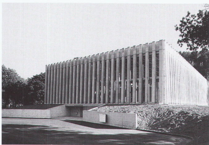
Mehrzweckhalle, Losone; Architekt: Livio Vacchini, Locarno