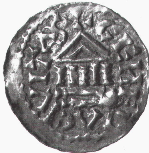
Genève, Musée d'art et d'histoire: Genève, Evêché, Adalgo de II, 1031, obole

München, Kunsthalle der Hypo-Kultur-Stiftung Königreiche am Nil: Schätze des antiken Sudan bis 6.1.1997