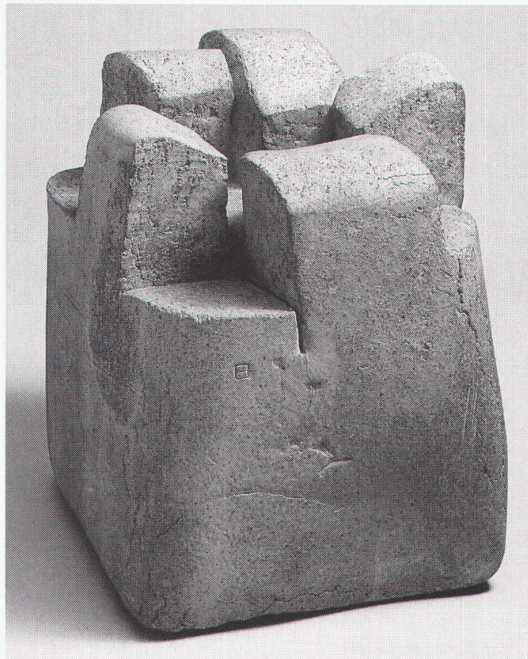
Zürich, Museum Bellerive: Eduardo Chillida, «Lurra G 180», 1990