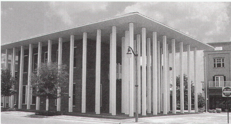
Philip Johnson: Stadthaus als Karikatur von H. Tessenow's Kurbad-Entwurf für Rügen

Celebration ist nicht nur an seiner romantisch historisierenden Oberfläche perfekt, sondern auch in seinen Funktionen als Stadt des 21. Jahrhunderts. Man hat aus den Fehlern der All-American-Suburbia gelernt und Konsequenzen gezogen. So gibt es in Celebration keine Sackgassen, sondern ein echtes Strassennetz, welches Downtown mit den Wohngebieten und diese untereinander in Fussgängerdistanz verbindet. Alle Strassen sind mit Bäumen bepflanz und relativ schmal, was Intimität schafft und sich auf den Massstab des Fussgängers oder Fahrradfahrers bezieht. Die Garagen werden (in den USA völlig untypisch) hinter das Haus verbannt, während nach vorne hin die meisten Häuser eine grosse Veranda haben. Es entsteht nachbarschaftliches Gesellschaftsleben statt anonymer Abgrenzung. In Celebration gibt es keine Shopping Centers, sondern Fachgeschäfte in einem kleinteiligen Stadtzentrum, was die Kommunikation zwischen den Kunden und zwischen Kunden und Verkäufer verstärkt. Die Kommunikation unter den Bewohnern der Stadt ist eines der wichtigsten Anliegen der Planer, denn nur durch intensiven Austausch kann es zu einem Celebration-Gemeinschaftsgefühl kommen. Mit stadtplanerischen Massnahmen und modernster Technologie werden dafür möglichst ideale Voraussetzungen geschaffen. So sind sämtliche Haushalte, Geschäfte, Restaurants und alle «öffentlichen» Gebäude online miteinander vernetzt. Hier werden Tips über Babypflege, Heckenschneiden oder Cookie-Rezepte aus-