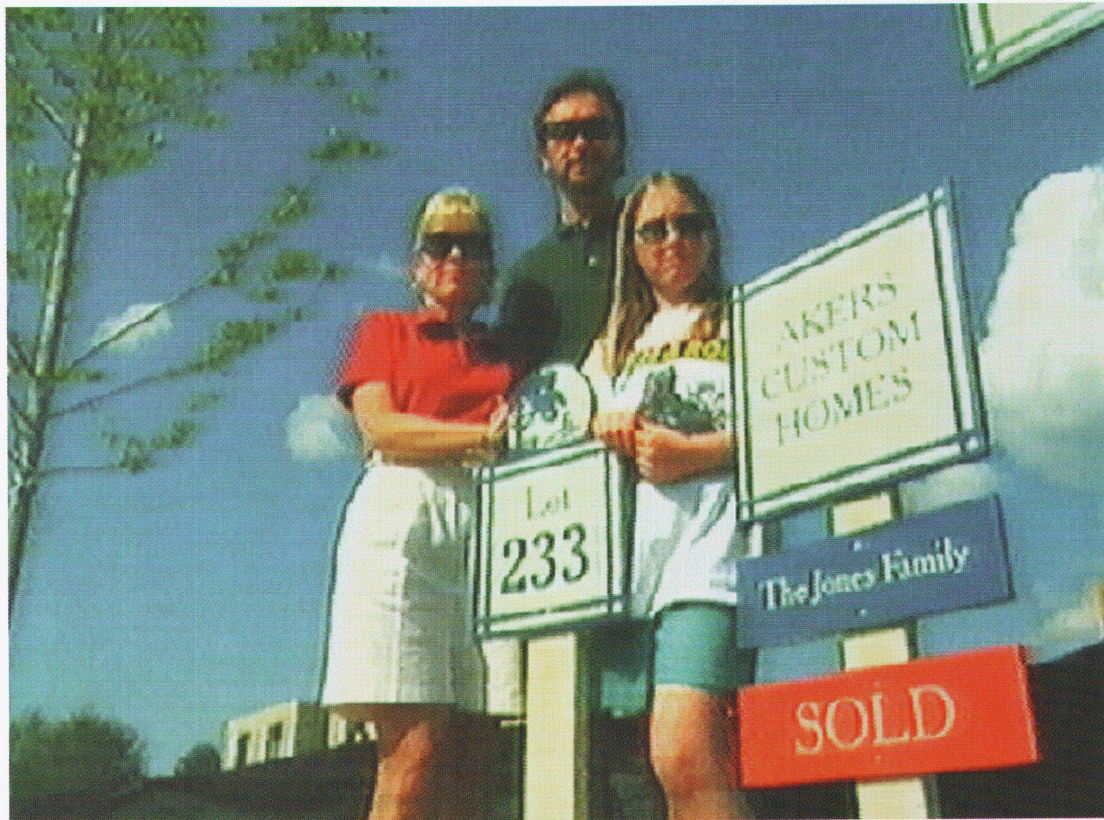
Die Familie Jones, stolze Eigenheimbesitzerin in Celebration ■ La famille Jones, fière propriétaire de maison à Celebration ■ The Jones family, proud home owner in Celebration

Foto: Videostandbild aus dem BBC- Dokumentarfilm über Celebration von Benjamin Woolley