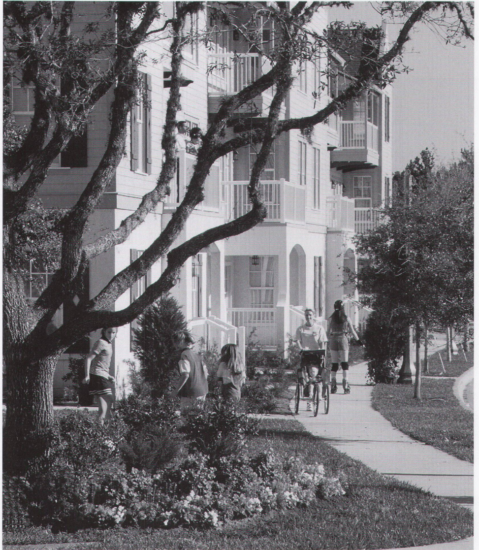
Mehrfamilienhäuser mit Luxuswohnungen im Stadtzentrum ■ Maisons plurifamiliales avec appartements de luxe au centre-ville ■ Luxury apartment buildings in downtown district