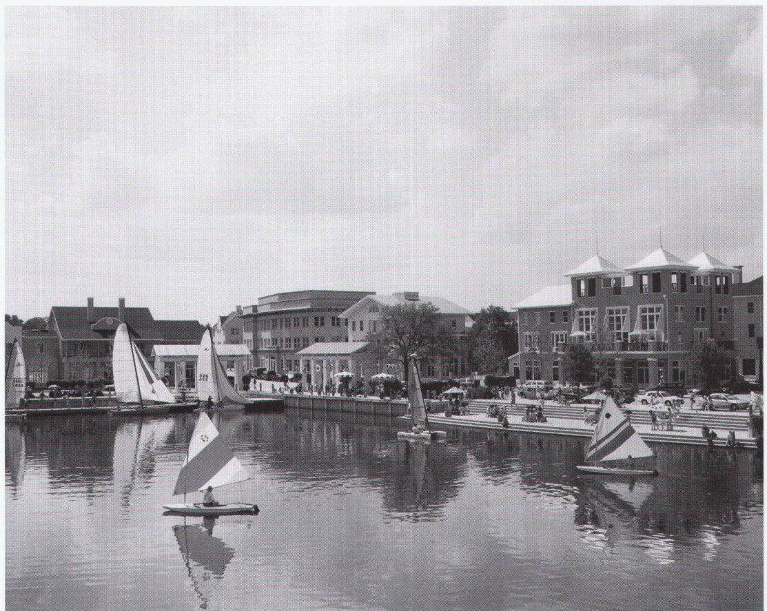
Geschäftsviertel am See ■ Zone d'affaires le long du lac ■ Lakefront business district

Direktes Vorbild von Celebration ist Main Street USA, das Zentrum der Magic Kingdom Parks in Anaheim, Orlando, Tokio und Paris. Main Street USA ist aber nicht die Nachbildung einer realen Hauptstrasse zur Jahrhundertwende, die in dieser Dichte niemals existent war, sondern die Simulation der filmischen Umsetzung einer solchen Strasse. Das mediale Abbild einer Strasse wird in den Köpfen der Amerikaner also als echter und authentischer wahr-