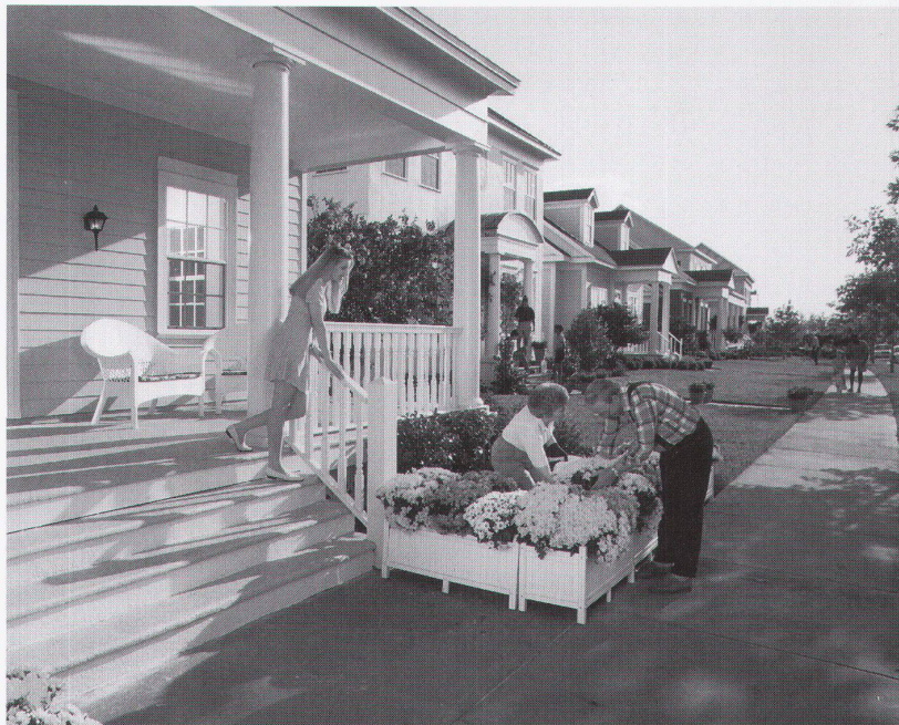
Teal Avenue: Einfamilienhäuser der ersten Bauphase ■ Maisons individuelles de la première phase ■ Phase one cottage homes