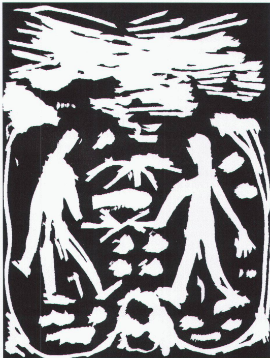
Sundern, Stadtgalerie: A. R. Penck, Das Paar, 1987, Holzschnitt

Bonn, Kunst- und Ausstellungshalle BRD Kunst aus Österreich 1896–1996 bis 10.11. Die grossen Sammlungen IV: Moderna Museet, Stockholm bis 12.1.1997