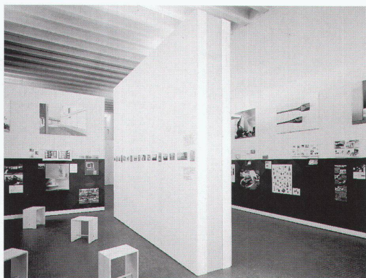
Lausanne, Ecole polytechnique fédérale: Pavillon suisse à la Triennale de Milan 1996

Teilnahmeberechtigt sind natürliche Personen, die am Tage der Auslobung in einem der Mitgliedsstaaten des EWR-Abkommens oder in der Schweiz mit Wohn- oder Geschäftssitz ansässig sind, nach dem Recht ihres Heimatstaates zur Führung der Berufsbezeichnung «Architekt» berechtigt sind und ihren Beruf selbstständig/freischaufend ausüben. Ständige Projektpartnerschaften sind teilnahmeberechtigt, wenn mindestens einer der Partner nach den obenge-