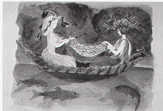
Warth, Museum des Kantons Thurgau: Ernst Kreidolf, «Cipripedium & Centaura», 1923, Entwurf zum Kinderbuch «Alpenblumenmärchen»

Wien, Museum Moderner Kunst, Stiftung Ludwig Palais Liechtenstein Lucio Fontana: Retrospektive bis 6.1.1997