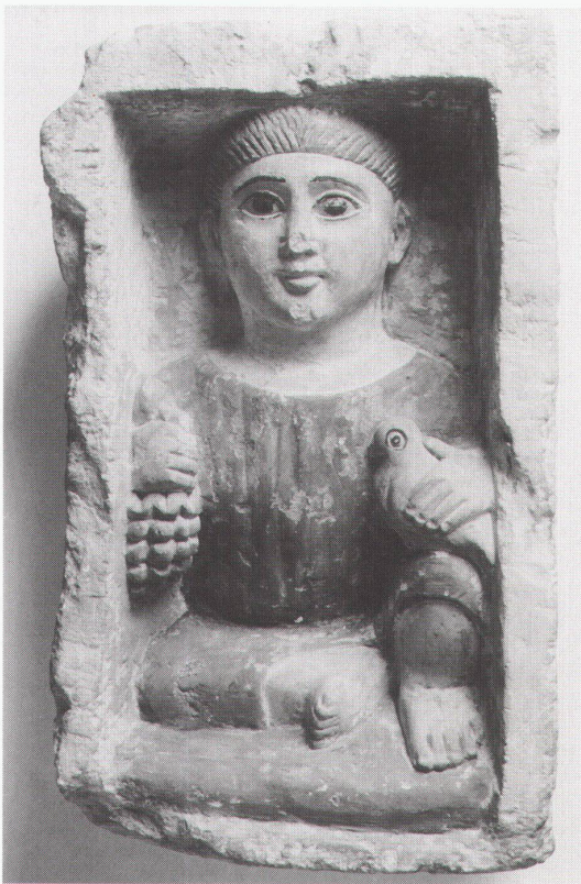
Hamm, Gustav-Lübcke-Museum: Grabrelief eines Knaben, 3.–4. Jh.n.Chr.

Dresden, Deutsches Hygiene-Museum Die Pille. Von der Lust und von der Liebe bis 31.12. Homöopathie 1796–1996: Eine Heilkunde und ihre Geschichte bis 20.10.