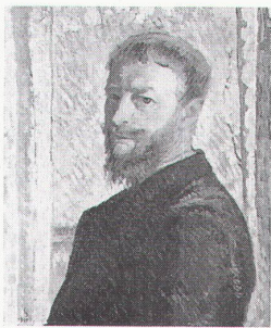
Winterthur, Kunstmuseum: Giovanni Giacometti, Selbstbildnis