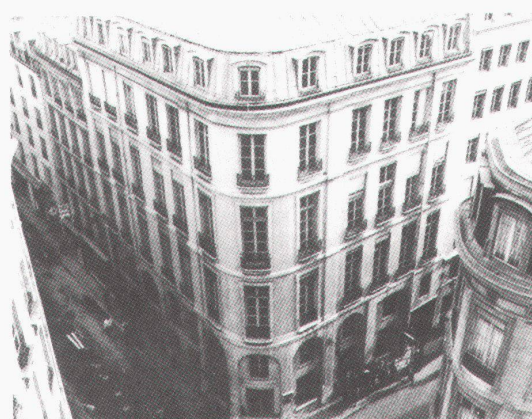
Architektur für den Film ist kein Film über Architektur (Szene aus «Metropolis», Deutschland 1926; Regie: Fritz Lang)