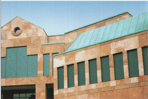
SEGA-Bank Olten, Architekten Hauswirth & Partner AG

3322 Schönbühl, Tel. 031 859 23 13 5600 Lenzburg, Tel. 064 51 28 15 8962 Bergdietikon, Tel. 01 741 50 52