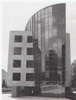
Banque de Luxembourg 2 Ansichten vom Boulevard Royal