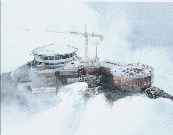
Schilthorn Gipfelstation, Architekt A.F. Feuz

R. Diem · CP 93 · 1000 Lausanne 4 Tél. 021/3127869 · Fax 021/3129763