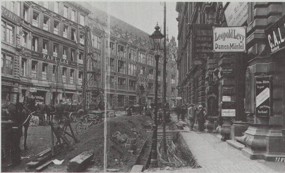
Taubenstrasse, Berlin, 1907

in der Fähigkeit, der Banalität dieser Ereignisse eine Form zu geben, die über sie hinausweist.