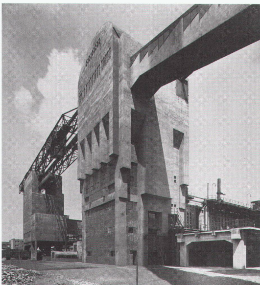
Adolf Meyer: Gaswerk Ost, Kokerei, Frankfurt, 1926/27

1 Hesse, Hermann: Wilhelm Meisters Lehrjahre (um 1911). In: Gesammelte Schriften. 7. Band, Frankfurt am Main 1978. S. 15 2 A.a.O., S. 15