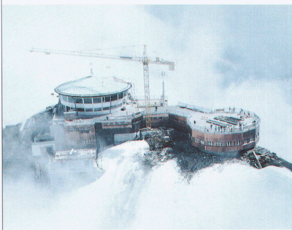
Schilthorn Gipfelstation, Architekt A.F. Feuz

5726 UNTERKULM Tel. 064 46 91 91 3097 BERN-LIEBEFELD Tel. 031 972 41 31 1018 LAUSANNE Tel. 021 646 50 36 4057 BASEL Tel. 061 691 95 55 8045 ZÜRICH Tel. 01 462 58 33 6500 BELLINZONA Tel. 092 25 87 63