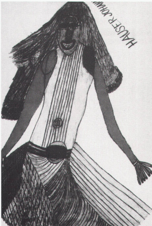
Lausanne, Collection de l'Art Brut: Détournements d'images

Cincinnati, Art Museum In the Classical Mode bis 24.4.