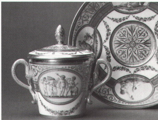
Dortmund, Museum für Kunst und Kulturgeschichte: Porzellan der Goethezeit

Den Haag, Gemeentemuseum Constant: New Babylon – Models bis 3.4.