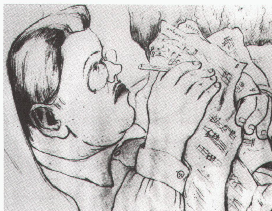
Lausanne, Fondation de l'Hermitage: Diaghilev étudiant une partition à Ouchy (1915)