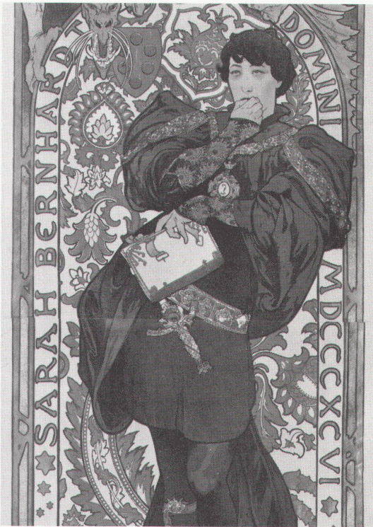
Krefeld, Kaiser Wilhelm Museum: Alfons Mucha, Plakat für Sarah Bernhardt, 1896

Bremen, Kunsthalle Bernardo Bellotto, genannt Canaletto: Radierungen aus Dresden und Umgebung bis 13.6. Holländische und Flämische Malerei des 16. und 17. Jahrhunderts aus eigenem Besitz bis 27.6.