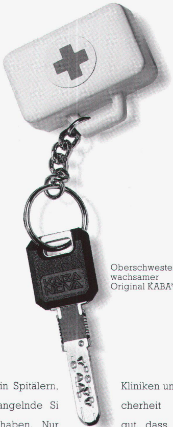
Oberschwester Silvias wachsamer Original KABA® NOVA.

Kontrolle eingeschlossen. Medikamente eingeschlossen.