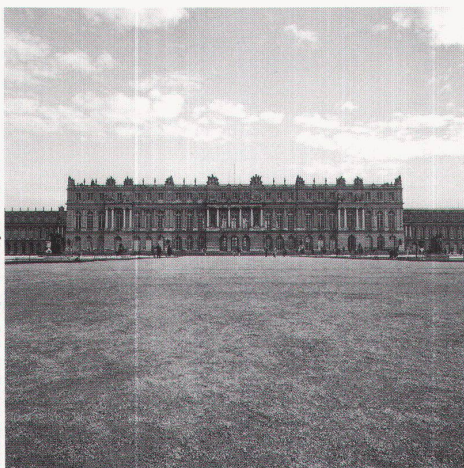
Schloss Versailles 1612-70, L. Leveau, J. H. Mansart