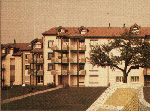
Atelier René Villiger ASG, Siss