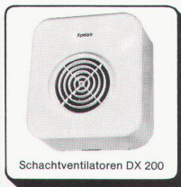
Schachtventilatoren DX 200