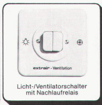
Licht-/Ventilatorschalter mit Nachlaufrelais