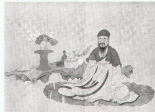
Die vier Freuden des Nan Sheng-lu (Detail) von Chien Hung-shou