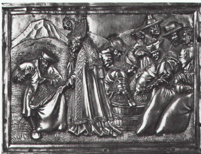
Szene aus der Vita von Nikolaus von Miva: Hungersnot

Museum für Kunst und Geschichte Fribourg Der Kirchenschatz des St.Niklausen- münsters in Freiburg bis 9.10.