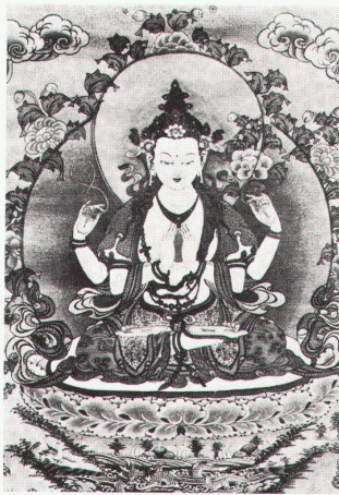
Thangkas – tibetische Rollbilder

Museum für Ostasiatische Kunst Köln Meisterwerke ostasiatischer Kunst – Malerei, Plastik, Kunsthandwerk aus China, Korea und Japan bis 31.12. Sagemono – der Gürtelschmuck der Japaner bis 2.1.1983