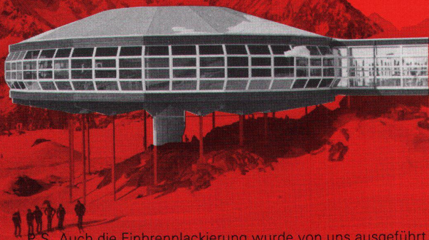
P. S. Auch die Einbrennlackierung wurde von uns ausgeführt.

Im Bergrestaurant Bettmerhorn (2650 M. ü. M.) herrscht eine behagliche Atmosphäre. Dafür sorgen nicht zuletzt die Panoramafenster aus vollisolierten Aluminiumprofilen. Seit Jahren werden Fenster, Türen und Fassaden mit dem energiesparenden, unterhaltsfreien ALISOL 2 gebaut.