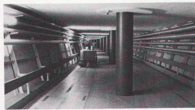
Transportkanal für Handgepäck im Flughafenbahnhof Kloten. VERMIPAN-Platten, 40 mm dick. Totale Wandlänge ca. 1200 Meter.

fach ist und mit allen, in jedem Schreinereibetrieb üblichen Hartmetallwerkzeugen vorgenommen werden kann. . . . weil VERMIPAN-Platten rohbelassen, gestrichen, verputzt, furniert oder mit Kunststoffplatten, Blech sowie irgend einem anderen, Ihren Wünschen entsprechenden Material, belegt werden können.