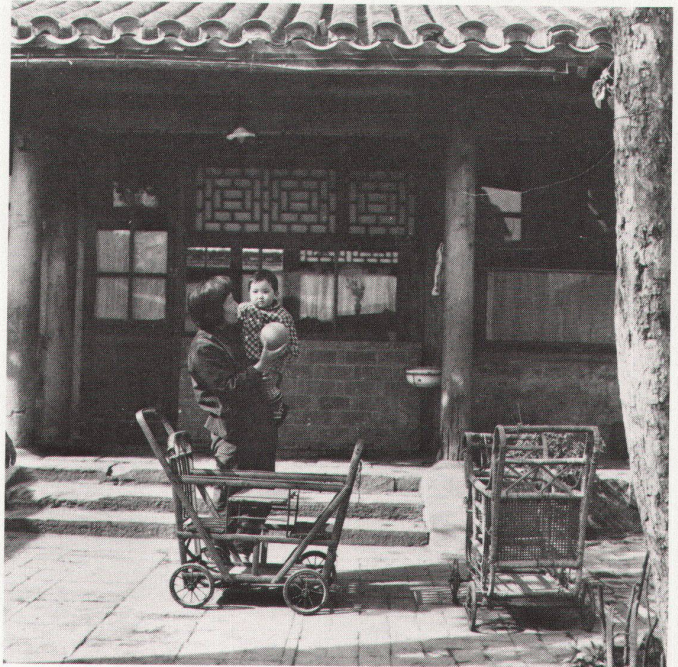
74 Kindertagesheim an der Volksstrasse in Peking. Haupteingang an der Erschliessungsstrasse. / Crèche d'enfants à la rue du Peuple à Pékin. Entrée principale sur la voie d'accès. 75 Kindertagesheim. Hoffläche für Gruppenspiele. / Crèche d'enfants. Cour servant aux jeux de groupe. 76 Hofgemeinschaft an der Jia-dao-Ku-Allee in Peking; Aussenmauer mit Steinwand im Innern. / Communauté de cour à l'allée Jia-dao-Kou à Pékin; mur extérieur avec paroi de pierre à l'intérieur. 77 Hofgemeinschaft an der Nian-Zi-Allee in Peking. Der Standard-Kinderwagen in Bambus erfüllt mehrere Funktionen: Liegen und Sitzen für 1–2 Kinder, überdies kleine häusliche Transporte. / Communauté de cour sur l'allée Nian-Zi à Pékin. La poussette en bambou standard offre plusieurs possibilités: 1–2 enfants assis ou couchés, et elle sert aussi de chariot pour petits transports ménagers.

strassen her im Abstand von ca. 60–70 m stellt einen idealen Grundraster für die Ent- und Versorgung der Wohneinheiten dar. Der Siedlungstyp enthält einen vielfach räumlich differenzierten Ausbau: vom Hofstyp mit nur einem Haus bis zu mehrhöfi-