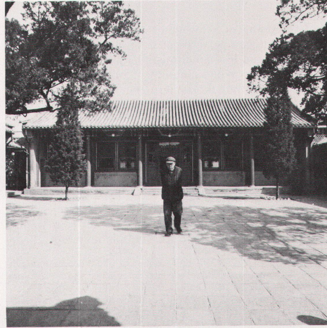
78 Hofgemeinschaft an der Ni-shi-Allee in Peking. Wohn- und Schlafraum mit traditionellem Bilderschmuck. / Communauté de cour sur l'allée Ni-shi à Pékin. Pièce d'habitation et chambre à coucher avec décor traditionnel. 79 Volkskommune «Roter Stern» bei Peking (Baujahr 1977). / La Commune de «l'Etoile Rouge» près de Pékin (construite en 1977). 80 Szechuan Restaurant in Peking. Eingangspartie mit grossem Vorplatz. / Restaurant Szechouan à Pékin. Entrée avec grande place. 81 Innenhof mit nach Süden gerichtetem Hauptbau. / Cour intérieure avec le bâtiment principal orienté vers le sud.

und verlangen natürlich ein grosses gegenseitiges Entgegenkommen. Über Jahrhunderte haben die Chinesen ein reibungsloses Zusammenleben grösserer Bevölkerungsmassen auf engstem Raume vordemonstriert. Durch den enormen Bevölkerungszuwachs wird die innerstädtische Wohnform der Hofhäuser durch