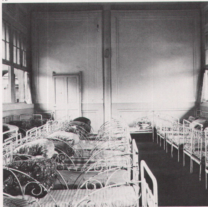
70 Hsi-shi Hofhaus in Peking, heute Kindergarten. / Maison Hsi-shi sur cour à Pékin, actuellement jardin d'enfants. 71 Hsi-shi Hofhaus; quadratischer Hof als Spielfläche. / Maison Hsi-shi sur cour; cour carrée servant de place de jeu. 72 Hsi-shi Hofhaus; Wandelgalerie mit Hof. / Maison sur cour Hsi-shi; ambuloire et cour. 73 Hsi-shi Hofhaus; Schlafraum im Mittelgebäude. / Maison sur cour Hsi-shi; dortoir dans le bâtiment central.

chinesische Pavillon-Architektur. Auf der zweiten Reise 1978 befasste ich mich vor allem mit Hofhäusern. Bedeutende Architekten unserer Zeit haben mich ermutigt, das Gesehene in einem Bildband und in einer Wanderausstellung unter dem Titel der klassischen Hofhaus-Architektur zu veröffentlichen. Ich durfte sogar nach meinem eigenen Pro-