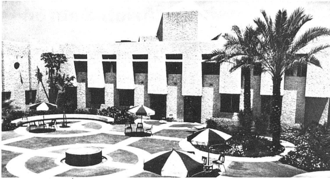
2 Geha-Krankenhaus für Geistes- kranke 1972. Gartenhof für Rekona- valeszenz.

bewerb für die Histadrutausstellung, die die Tätigkeit der Allgemeinen Arbeiterföderation zeigen will. Die vier Pavillons, aufgebaut aus modularen Holzelementen, verlassen in ihrer geometrischen Ordnung den rechten Winkel, im Aufriss sind Anklänge an die Geometrie des 6zackigen Sterns erkennbar. Die Coop-Wohnungsbauten – dreistöckig, Gartenhöfe umschliessend in den Ergebnissen der ersten Phase, Zeilenbauten, teilweise auf Pilo-