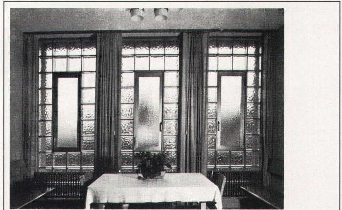
Glasbausteinfenster mit Anticorodal-Drehflügel in Sitzungszimmer.

Verlangen Sie unverbindlich Vorschläge und Kombinationszeichnungen