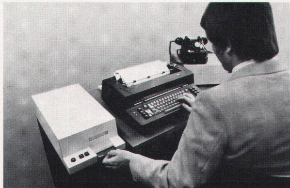
Das ist die Einrichtung, die Sie brauchen, um Computerleistung direkt am Arbeitsplatz zu erhalten: das Terminal IBM CMC (oder ein anderes Terminal), Modem und Telefon. Das Spezielle am Terminal IBM CMC ist, dass es sich zusätzlich als Magnetkartenschreibmaschine einsetzen lässt.

Viele Probleme lassen sich nun mit einem oder mehreren der über 600 CALL Anwendungsprogramme lösen. Diese sind verfügbar für den betriebswirtschaftlich-kommerziellen Bereich, für Mathematik, Technik und Planungsverfahren. Ausserdem ist es möglich, spezielle Programme für spezielle Probleme zu entwickeln: in den Sprachen BASIC, FORTRAN oder PL/1 sind sie sehr einfach und rasch zu formulieren.