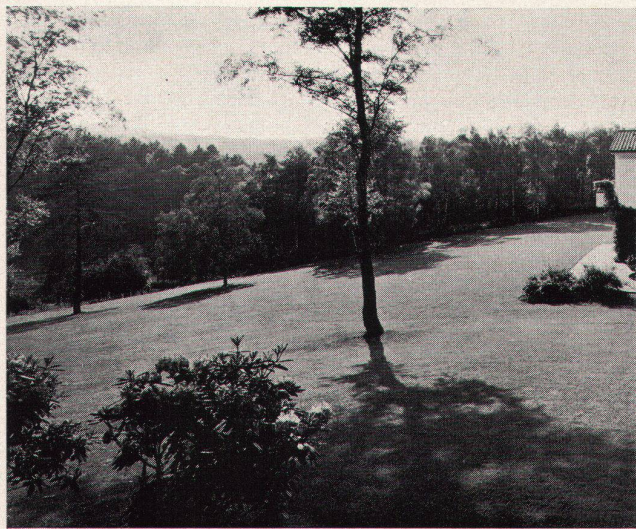
1 Gartenplan Haus P. in Aachen. Gartenarchitekt: Roland Weber, Düsseldorf