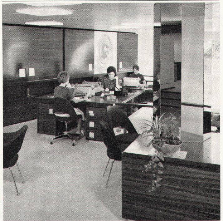
Bauschreinerei und Innenausbau