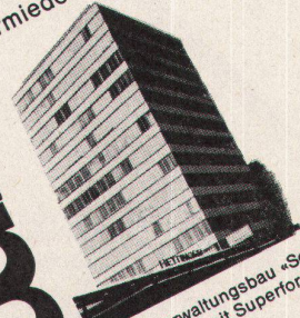
Der Verwaltungsbau «Schanze» Zürich ist mit Superform-Anlagen ausgestattet

2 Der Superform-Kunstharzsitz mit wesentlichen technischen Neuerungen: a) Innerer Rand des Sitzes gegen die Schüssel hinein verlängert, dadurch kein offener Spalt mehr zwischen Sitz und Schüsselrand. Der Sitz erhält deshalb auch eine wesentliche Verstärkung. b) Ferner Stützpuffer verschieden hoch untereinander auswechselbar, dadurch können Spannungen im Sitz vermieden werden.