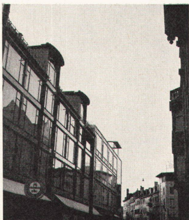
6 Alt und Neu – das eigene Gesicht und das der Nachbarn in der Glasfassade

7 Die neue Stadt. Die Flachdächer begrenzen auch hier einen Raum, sind ein Rahmen um Straßen und Plätze