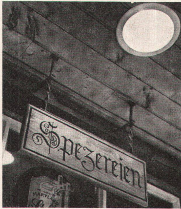
Berner Laubenromantik 1960 mit Holzschnitzerei, Schmiedeisen und Spotlight