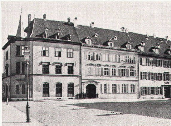
2 Das Antistitium vor dem Umbau L'Antistitium avant la restauration The Antistitium before the restoration