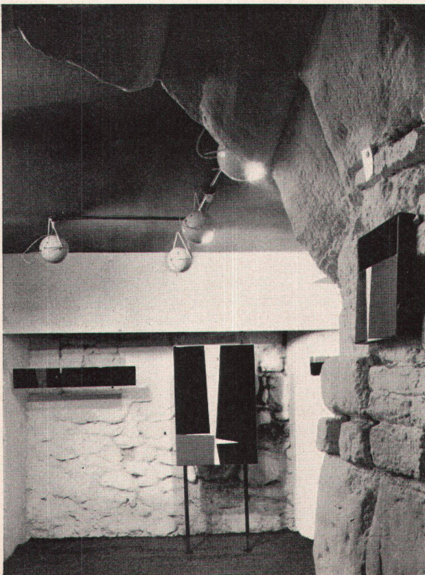
Ausstellung Jean Baier in der neuen Keller-galerie Elphenor in Genf

Il semble qu'entre la vigueur et la solidité de la période fauve et les abondantes productions qui lui font suite quelque chose se soit progressivement dégradé dans le style de Derain. On sent une sorte de retour à certaines conventions, la crainte des audaces extrêmes: et tout ce mouvement ne s'accompagne pas – comme on devrait s'y attendre – d'une sérénité équilibrée, d'une sorte de matu-