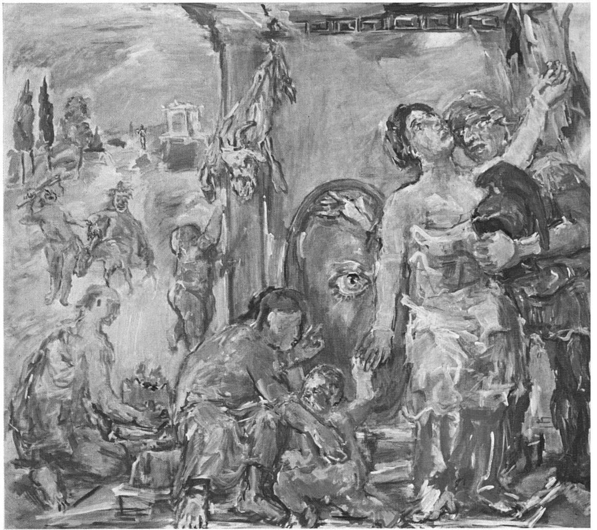
Les Thermopyles. Peinture murale pour l'Université de Hambourg