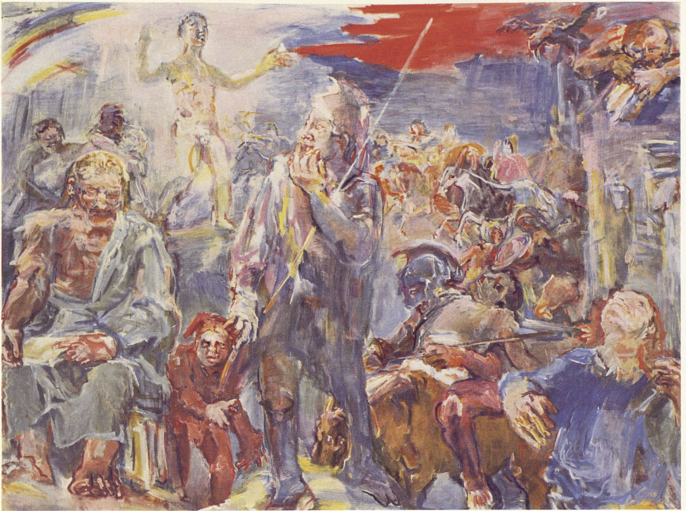
Oskar Kokoschka, Thermopylae 1954. Wandbild für die Universität Hamburg. Mittelbild: 2,25 × 3 m; Seitenbilder: je 2,25 × 2,5 m