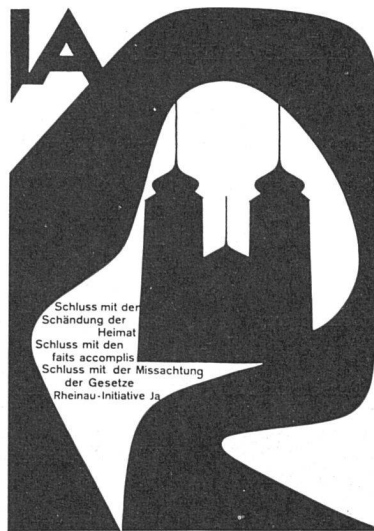
Entwerfer: Armin Hofmann SWB, Basel. Als Abstimmungsplakat von der Prämierung ausgeschlossen

Aus den formalen Elementen ihres mit Recht prämierten Plakates «Brasilianische Architektur» hat Mary Vieira für die Zeit der Ausstellung zwei Skulpturen am Eingang des Zürcher Kunstgewerbemuseums geschaffen: eine neue und interessante Möglichkeit, die Wirkung eines Plakats in die dritte Dimension zu übertragen und zu akzentuieren.