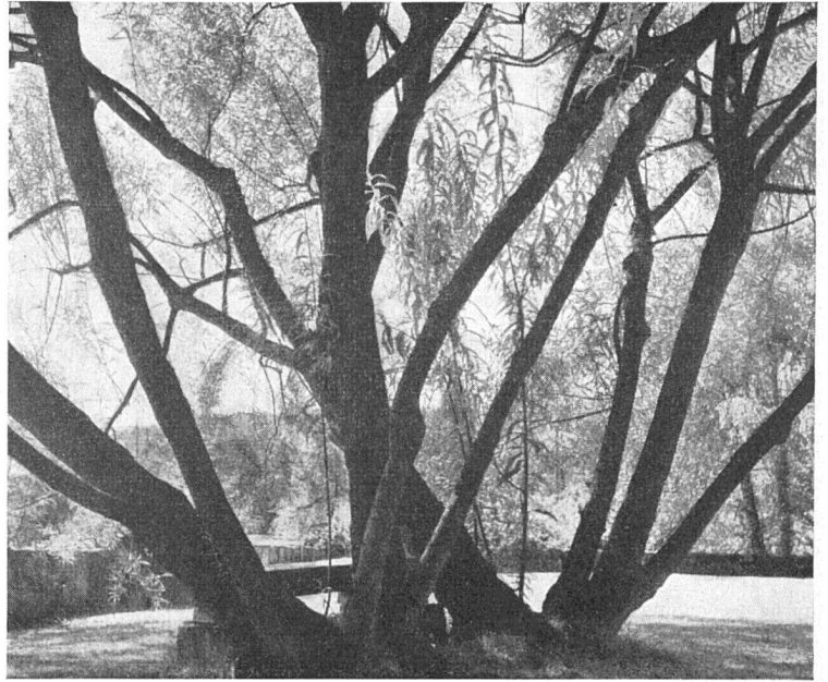
Weidenbaum. Foto: Bernhard Moosbrugger SWB, Zürich Aus: Ernst Baumann: Neue Gärten, Zürich 1955

Die Untersuchungen von Ernst Baumann beschränken sich auf folgende Gartentypen: Garten in der Stadt – Garten am Hang – Garten am See – Garten auf dem Hügel – Landschaftsgarten am See – Siedlergarten – Der kleine Wohngarten. In der sorgsamen Behandlung dieser Beispiele wird von der Charakterisierung des gegebenen Geländes zur gartenräumlichen Umgestaltung bis zur detaillierten liebevollen Beschreibung der Bepflanzung und einzelnen Blume geschritten. Das Buch lehrt einmal mehr, wie wesentlich und wichtig die Mitarbeit des Gartengestalters schon beim frühen Beginnen der Projektierung eines Hauses durch den Architekten ist. Er sollte schon bei der Wahl des Geländes vom Bauherrn und Architekten beigezogen werden. Dies war offenbar auch bei verschiedenen der acht ausgewählten Beispiele nicht der Fall, und der Garten-