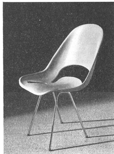
Gartenstuhl mit Schale aus Stellafort. Entwurf: W. Frey SWB, Innenarchitekt, Basel

vorzügliche Formbarkeit der Phantasie des Stuhlzeichners freie Entwicklung ermöglicht, kann sich das Bild des modernen Gartenmöbels verfeinern.