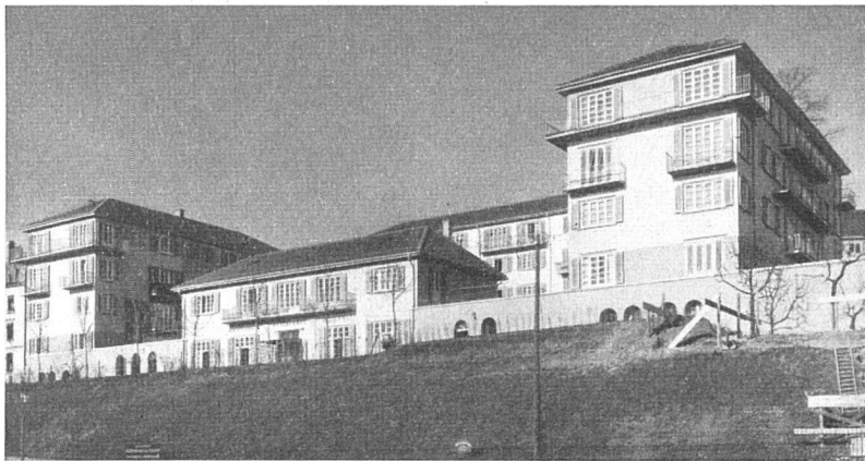
Bauten von Lux Guyer. Wohnungen für alleinstehende Frauen in Zürich-Letten 1927