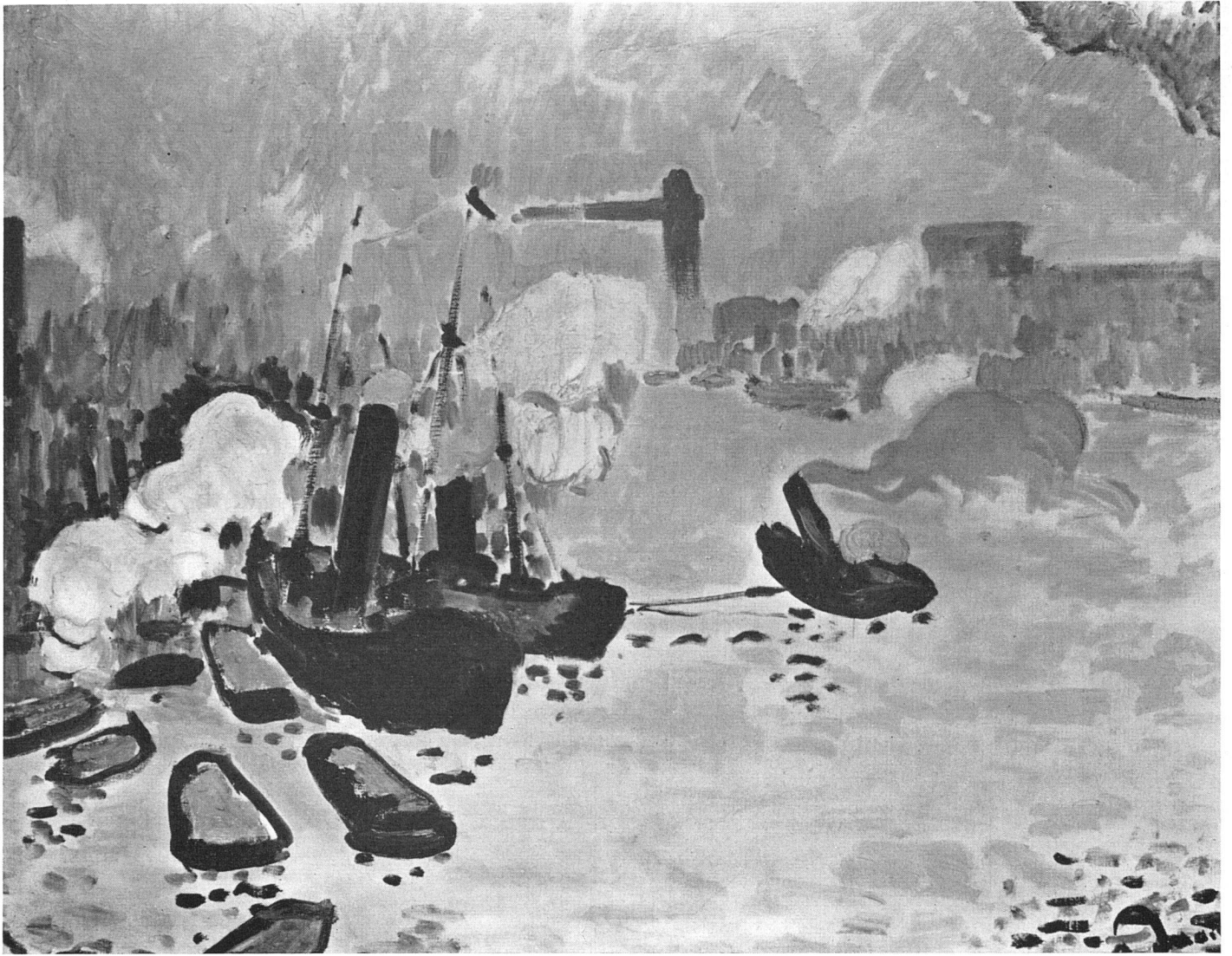
André Derain, Auf der Themse , 1904 | Sur la Tamise | On the Thames