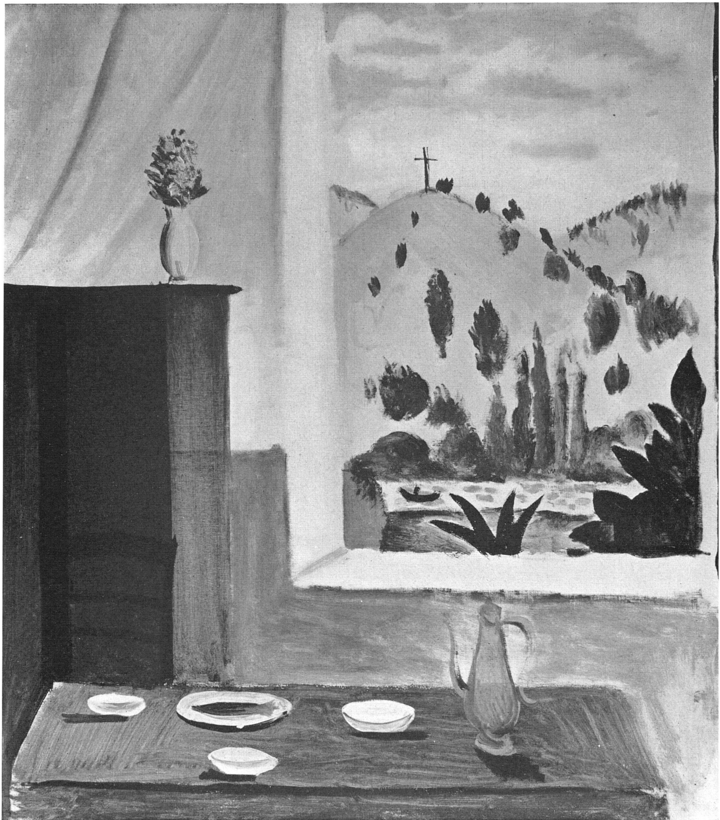
André Derain, Der Kalvarienberg , um 1913. Öffentliche Kunstsammlung Basel | Le Calvaire | Calvary

handen war, das auf die Dauer auch unter andern äußern Umständen aktiver hervorgetreten wäre als sein Sinn für Erneuerung. Mitten im Kriege schrieb Guillaume Apollinaire in der Einführung zum Katalog der ersten großen Ausstellung, die man in Paris Derain