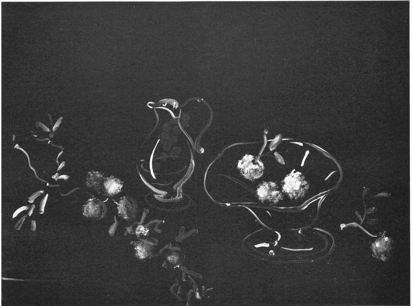
André Derain, Stilleben auf schwarzem Grund , 1948 | Nature morte à fond noir | Still Life on black background

in weiten Bereichen mit dem Willen zum Wiederanknüpfen an die großen Traditionen reagierte.