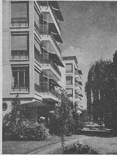
Kantonsspital Zürich, Bettenhaus Ost Architektengemeinschaft AKZ, Zürich