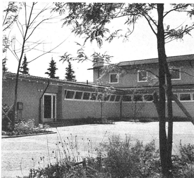
WINTERTHUR WIESENSTRASSE 3