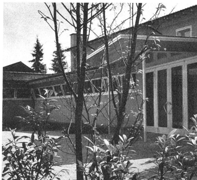
Kirchgemeindehaus Veltheim-Winterthur Architekt: Peter Germann SIA