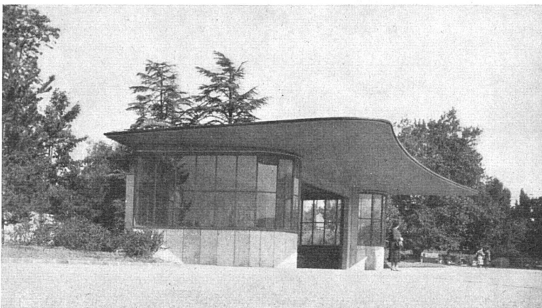
Wartehalle Place des Nations, Genf. 1949, Francis Quétant, Arch. BSA, P. Honegger, Ing. E. I. L., Genf

Diese Wartehalle dient den Autobuspassagieren des UNO-Gebäudes und der Nachbargebiete. Die Halle ist gegen die West- und Nordwinde verglast und weist außer Sitzbänken zwei Telephonkabinen, Briefkasten und zwei Aborte auf. Konstruktion: behauener Eisenbeton, Dachplatte auf drei Stützpunkten ruhend mit Versteifungsrippen. Verkleidung der Fensterbrüstungen mit hellgrünen Quarzitplatten von St. Nicolas (Wallis). Schreinerarbeiten aus Eichenholz. Neonbeleuchtung.