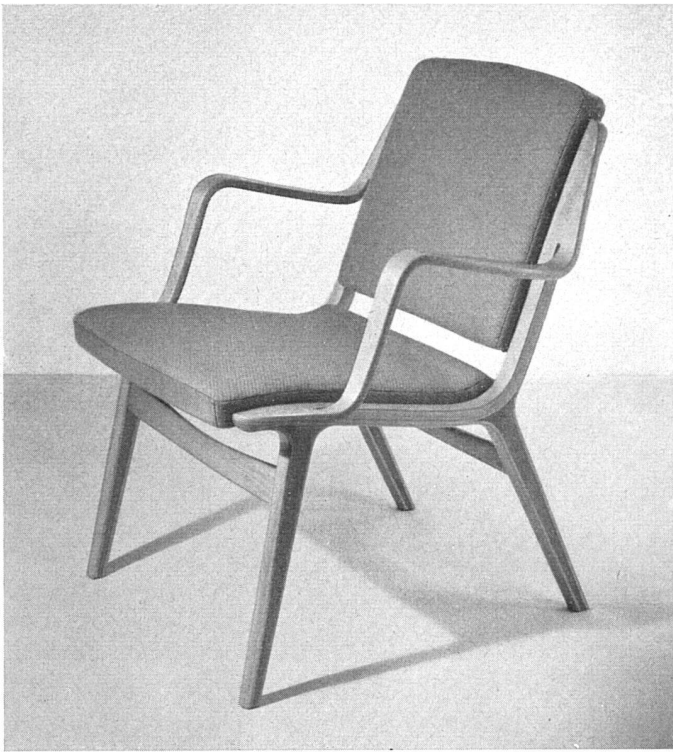
Armlehnstuhl, Entwurf: Peter Hvidt & Mølgaard Nieslen, Ausführung: Fritz Hansen Nachfolger | Armchair | Fauteuil

verleimtem Holz bestehende Modell kann entweder in Sperrholz (Lehne und Sitzfläche, Preis rund 75 Kronen!) mit leder- oder stoffartigem Überzug oder gepolstert erworben werden. Je nach Bedarf wird dieser Stuhl mit oder ohne Seitenlehne oder nur mit einer Seitenlehne geliefert, so daß durch Zusammenstellen daraus ein Sofa kombiniert werden kann. Dieser vielseitig verwendbare, ästhetisch einwandfreie und vor allem wirtschaftliche Stuhl (er kann vollkommen zerlegt werden) wird heute auch in großen Serien ins Ausland geliefert.