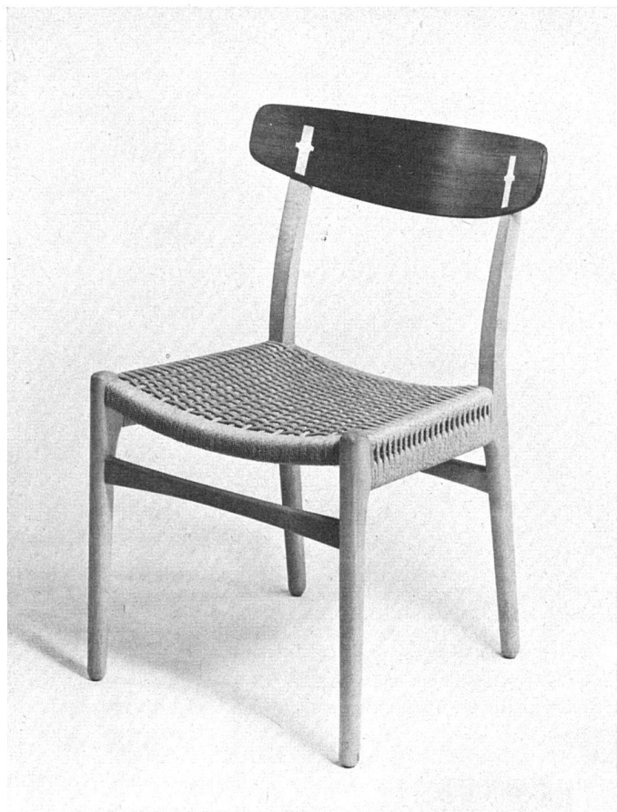
Eßzimmerstuhl. Rückenlehne Teakholz, Rahmen Buche, Sitz aus Papierschmurgflecht. Entwurf H. J. Wegner, Ausführung C. Hansen & Sohn, Odensee | Chaise de salle à manger | Diningroom chair, back of teak, frame of beech, seat of paper cords