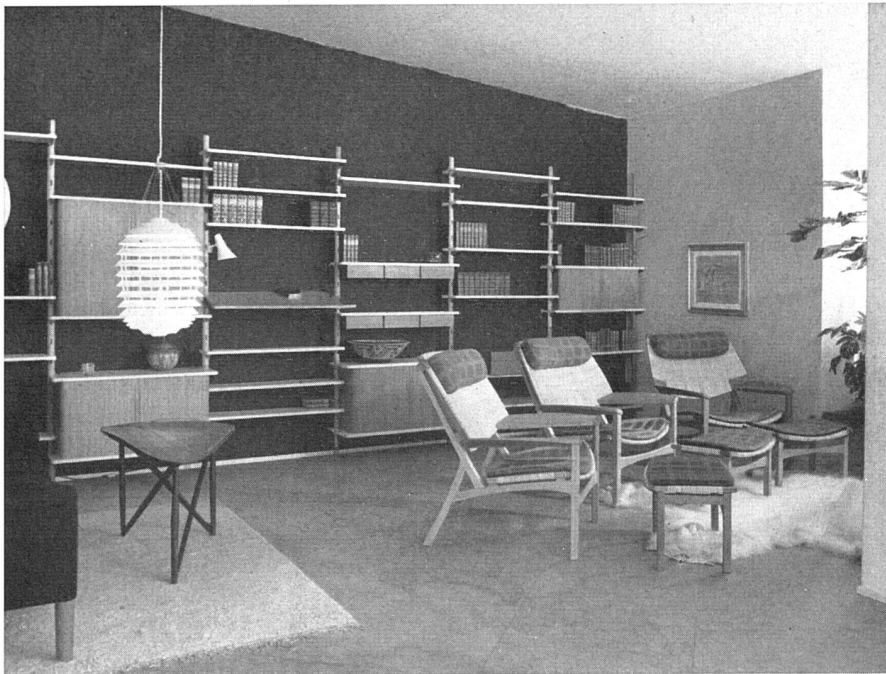
Aus der Schreiner Ausstellung in Kopenhagen 1951. Büchergestelle und Stühle in Eiche. Entwurf A. Bender und Ejner Larsen, Ausführung L. Pontoppidan | Bibliothèque et sièges de chêne | Book shelves and seats in oak